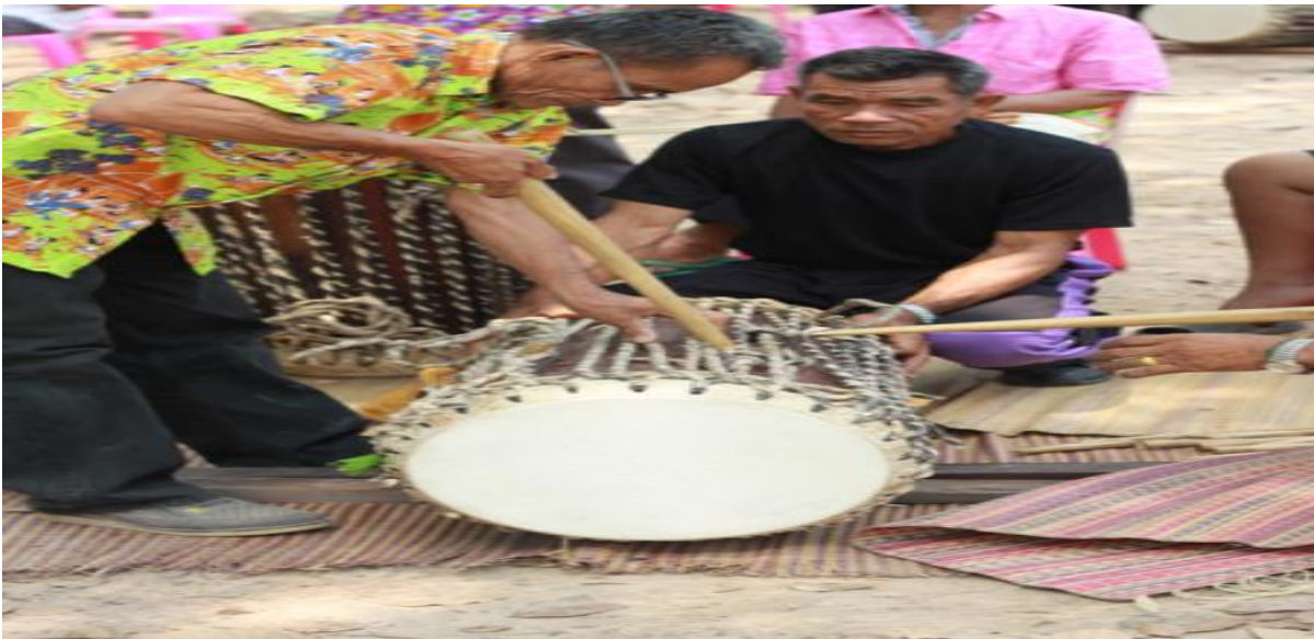
7.๓ ภูมิปัญญาท้องถิ่น ภาษาถิ่น