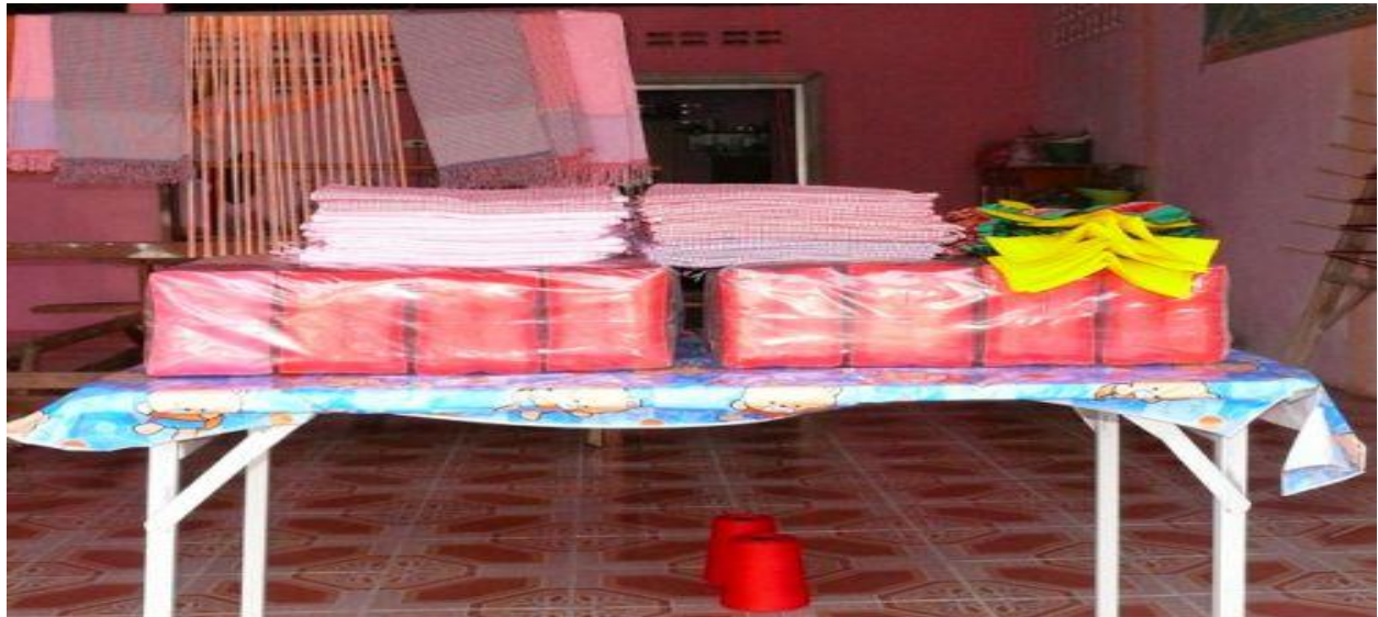
- การเขียนกระเป๋าสินค้า โอิที่อปกลุ่มแม่บ้านบ้านดอนหวาย