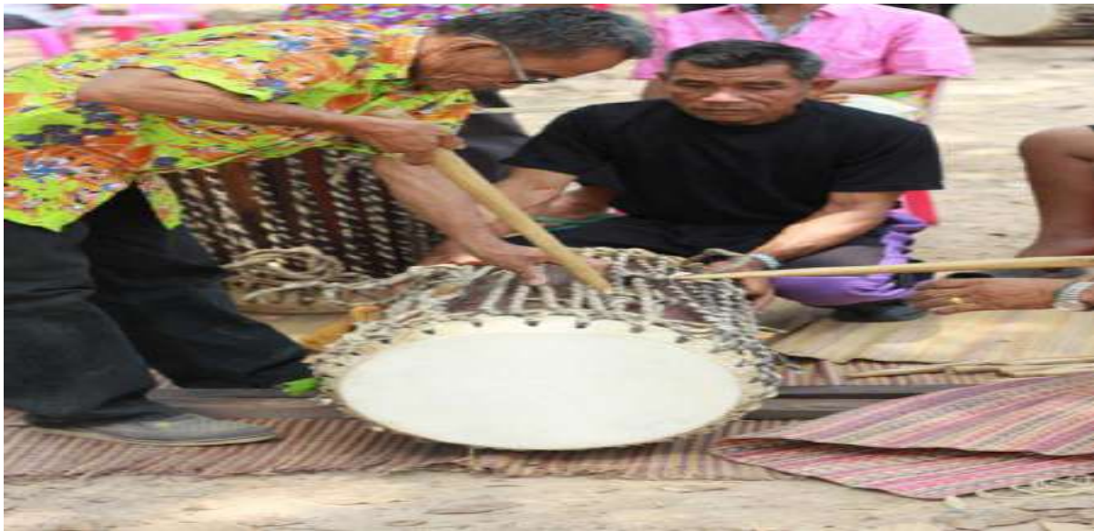
7.๓ ภูมิปัญญาท้องถิ่น ภาษาถิ่น